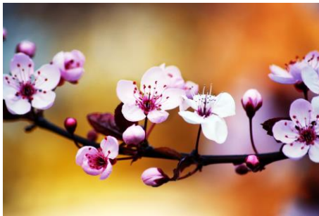
Image TERRESTRE : écoute d'une mélodie, marche en nature, douche régénérante...

TOUT EST UN TRAVAIL DE RESSENTIT AUCUN MECANISME (MENTAL)